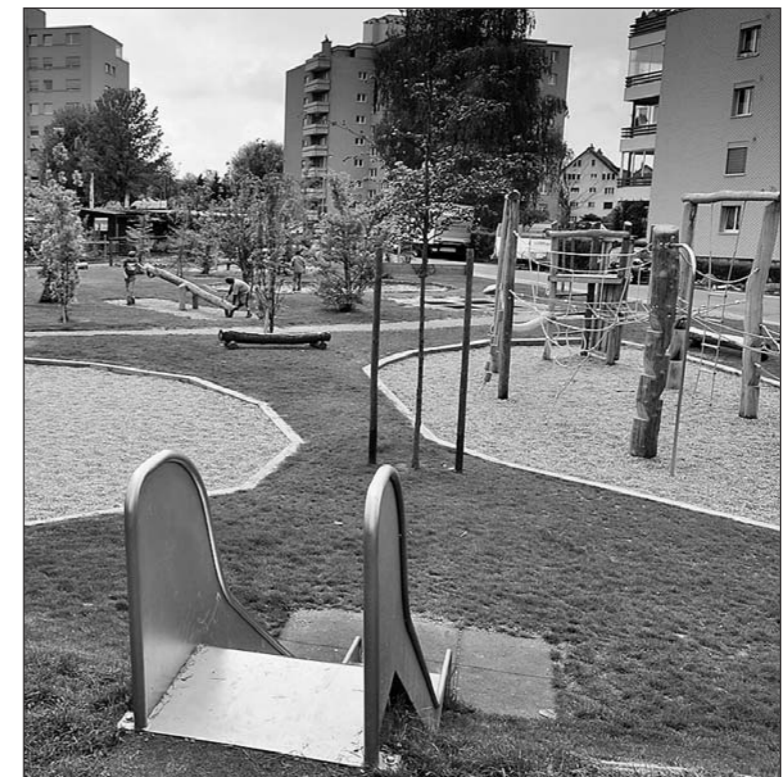
Ende Oktober werden auf dem Waldspielplatz Brühlstrasse durch die Mitarbeiter des Werkhofes zusätzliche Bäume und Sträucher gepflanzt.

Um diese Konflikte einvernehmlich zu lösen, wählte der Stadtrat den Weg der Mediation. Basierend auf den Resultaten der Mediation, wurde der Spielplatz im Verlauf der Sommermonate durch die Mitarbeiter des Werkhofes umgestaltet. Der Spielplatz erfreut sich weiterhin grosser Beliebtheit; umso mehr, da die Lärmemissionen durch den Abbau und die Umplatzierung von Spielgeräten reduziert werden