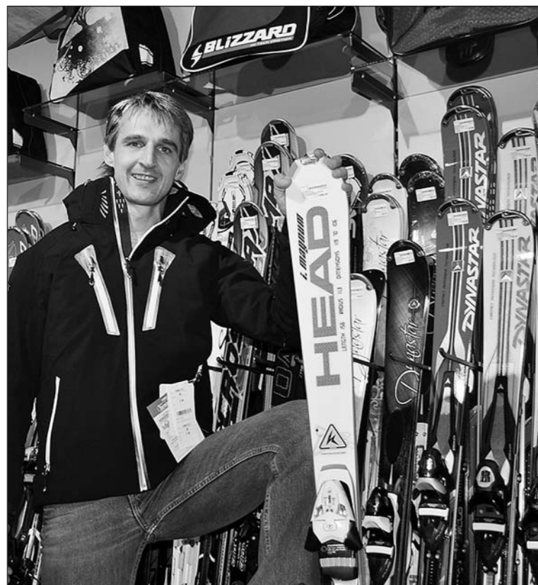
«Paddy Sport» – eine Topadresse für Freunde des Wintersports.

Die Wintersaison steht vor der Tür, und «Paddy Sport» an der Salwiesenstrasse 10 in Arbon ist darauf bestens vorbereitet. Präsentiert werden von kompetenten Fachkräften die neuesten Trends.