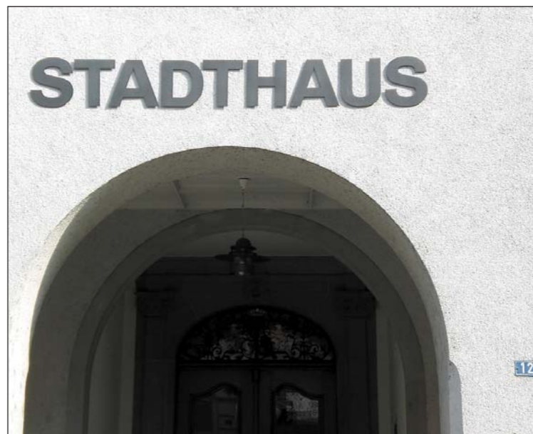
Hauptstrasse Nummer 12 – das Arboner Stadthaus.

Das Arboner Stadthaus an der Hauptstrasse trägt mit der Nummer 12 eine gerade Zahl, weil es auf der rechten Strassenseite steht. In aller Welt kennzeichnen die geraden Hausnummern die rechte und die ungeraden die linke Strassenseite. Die geraden Zahlen werden als die besseren empfunden, weil die 13 ungerade ist und angeblich Unglück bedeutet. Links, verwandt mit linksch im Sinn von schwach, ist schlecht gemäss Matthäus 25,33. Dort